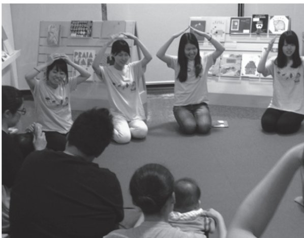
<写真3> 「イエラ・マリ展 字のない絵本の世界」での「えほんのじかん」実施風景

一方、「イエラ・マリ展 字のない絵本の世界」では、1階のみでの展示で、出入り口から一番離れた奥のスペースに「えほんコーナー」が設置された。（<写真3>参照）若干立ち入りにくい場ではあるが、展示されている「字のない絵本」という作品の性質に合った、静かな環境でゆったりと絵本を楽しむことのできる場となった。マットも円形で、「えほんのじかん」の際には学生と参加者が輪になって座り、ほどよい距離感をとりながら行うことができた。