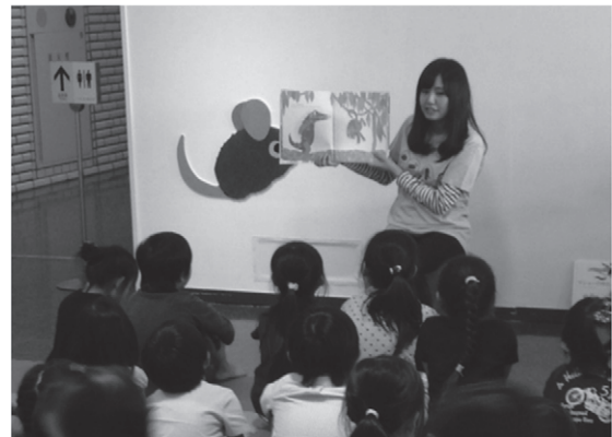
〈写真1〉「レオ・レオニ 絵本のしごと」での「えほんのじかん」実施風景①