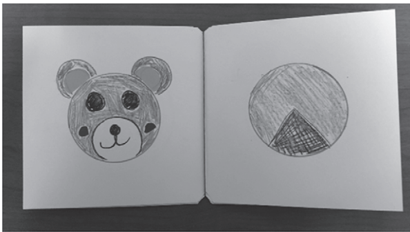
<写真4>「イエラ・マリ 字のない絵本の世界」展「○(まる)の絵本作り」制作物

わとりとたまご」読み聞かせ ③イエラ・マリ作品以外の「字のない絵本」の中から2冊（パット・ハッチンス『なんにかわるかな?』ほるぷ出版、太田大八『かさ』文研出版、など）読み聞かせ ④イエラ・マリ『まるいまあるい』『とおもったら……』読み聞かせ ⑤「○(まる)の絵本作り」の順で行った。③は各回によって入れ替えるが、それ以外は固定のプログラムとした。③で取り上げる「字のない絵本」も、絵本コーナーの作品の中から選んでいる。