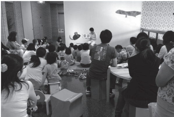
<写真2> 「レオ・レオニ 絵本のしごと」での「えほんのじかん」実施風景②

一方、「イエラ・マリ展 字のない絵本の世界」では、1階のみでの展示で、出入り口から一番離れた奥のスペースに「えほんコーナー」が設置された。（<写真3>参照）若干立ち入りにくい場ではあるが、展示されている「字のない絵本」という作品の性質に合った、静かな環境でゆったりと絵本を楽しむことのできる場となった。マットも円形で、「えほんのじかん」の際には学生と参加者が輪になって座り、ほどよい距離感をとりながら行うことができた。