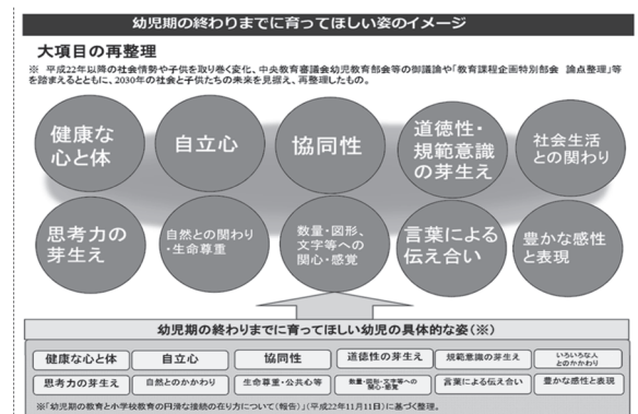
図1 幼児期の終わりまでに育てて欲しい10の姿

終わりまでに育ててほしい10の姿」が示された（文部科学省 2017）。幼児期の教育は遊びを通しての総合的な指導の取り組みから、「10の姿」が5歳の終わりまでに培われるようにと願い、意図して行っていくことが望まれる。そして5領域のねらい・内容について日々の保育のなかで、見通しをもって繰り返し積み重ねていき、その結果として「10の姿」が現れるようになることが大切であるといえる。